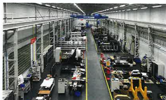
Impressionen vom Inneren der verschiedenen Hallen