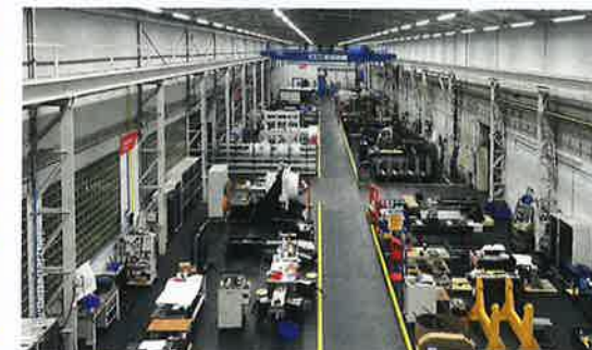
Impressionen vom Inneren der verschiedenen Hallen

Not der Betriebe hier am Standort, was neue Gewerbeflächen anbelangt, und somit ist dies ein wirklich positives Zeichen für den Industriestandort Mönchengladbach. Wir sind stolz, die Starrag Group bei der Entwicklung des Industrieparks gemeinsam mit der Wirtschaftsförderung beraten zu haben und freuen uns natürlich auf die weitere Zusammenarbeit im Zuge der Vermarktung der Flächen.“ Der Bezug der zu vermietenden Flächen ist für Mitte 2023 avisiert. Die Industriehallen haben Hallenhöhen bis zu 11,50 Meter und sind mit modernen Schwerlastkränen bis zu 50 t ausgestattet. Die neuen Mieter können die vorhandene Infrastruktur somit direkt einsetzen und mit ihrer eigenen Produktion starten. 📍